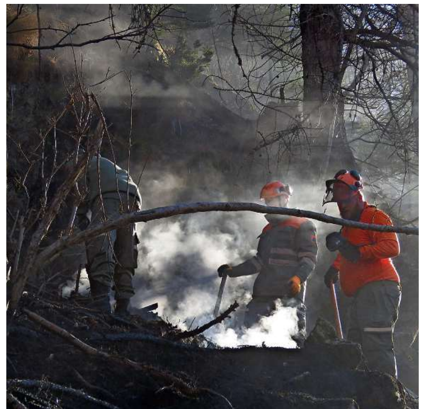
Der Schutzwald hat eine wichtige Funktion. Darum gilt es, ihn mit geeigneten Massnahmen zu schützen: z. B. vor fahrlässig verursachten Bränden.