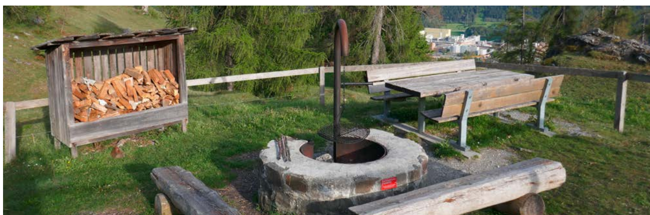
Focolare con anello in pietra